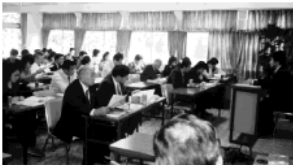
今年も年末調整の時期ですね

見学後は西伊豆から今回の宿泊地である南伊豆へと向かいました。夕陽に輝く西伊豆の風景には少し早い時間ではありましたが、車窓からの堂ヶ島をはじめとする景色には何度見ても感動させられ、心洗われる思いでした。