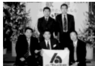
鹿児島大会は燃えましたよー