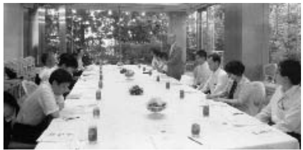
7月18日 役員会 (於: ウェストフィフティースード・日本閣)