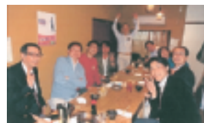
終了後も盛上って！（於：どんと晴れ）