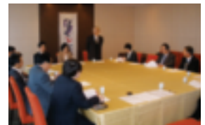
3月19日 役員会を開催