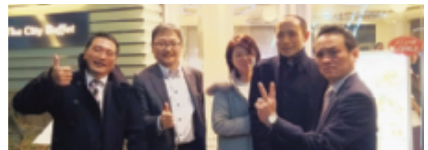
来年こそ優勝するゾー！

3月19日、東法連・青連協では、東京ドームボウリングセンターで「交流ボウリング大会」を開催し、当会より5名の方が参加しました。