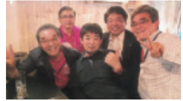
～～～～～ まちなかのバル in なべよこ ～～～～～