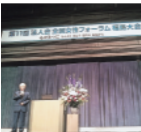
～4月14日：郡山市 参加された皆様～