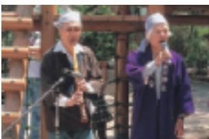
餅つき大会の立役者