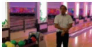
大会宣言：新井部会朝