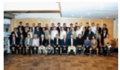
終了後：全員で記念撮影