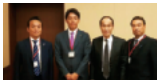
10/4 東法連・連絡協議会