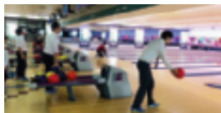
さあ！目指すはストライク…