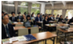
“マイナンバー” 特に重視して…