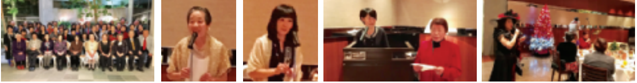
～ ～ ～ 12月4日「女性部会主催：クリスマスの夕べ」多くの皆様にご参加して頂きました ～ ～ ～