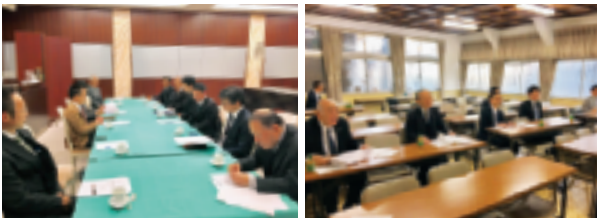
11月24日：役員会を開催 (於：日本閣) ～皆様、真剣に～