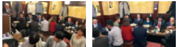
～ ～ ～ 12月8日 (於：俺んち) ～ ～ ～