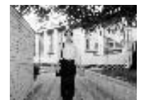
8月31日(於:信濃町にて)