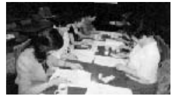
下半期の活動に向けて審議を…

9月11日、中野サンプラザに於いて役員会を行いました。今後の行事について、縷々意見交換を致しました。