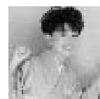
8月30日(於:サンプラザホール)