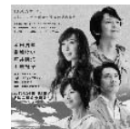
8月25日(於:新国立劇場)