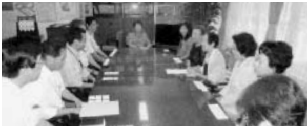
9月11日 署の幹部の皆様と