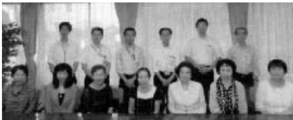
記念撮影（緊張しました！）