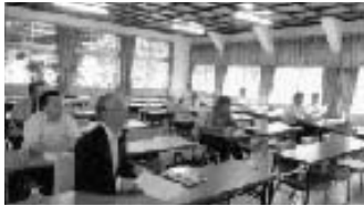
とても分かり易い講義に感謝