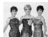
9月27日(於:サンプラザホール)