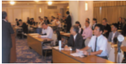
9月8日(火)「障がい者就労支援セミナー」