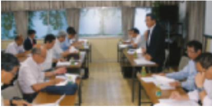
8月6日(木)「第2回支部長懇談会」