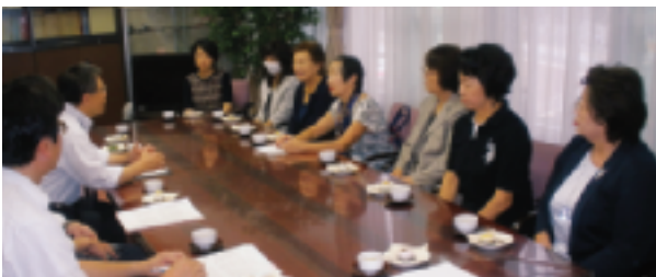
9月16日(署長を囲んで…)