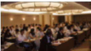
～多くの皆様に参加して頂きました～

始めに、内閣府がまとめた「マイナンバー 社会保障・税番号制度」を通して説明して頂きました。又、「国税分野における各種様式の変更点」、「番号法に基づく本人確認方法」や、