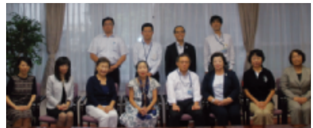
記念撮影(緊張しました!)