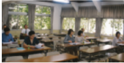
～ 8月26日(木) 中野法人会経営塾 第3弾 (於：法人会館) ～