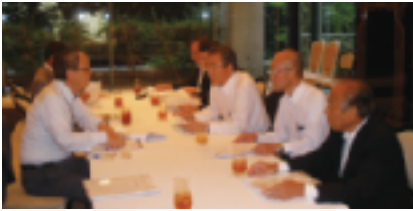
8月27日(木)「正副会長会」(於：日本閣)