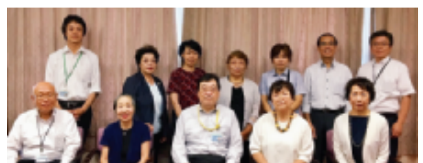
～～～ 9月5日 (署長を囲んで) ～～～