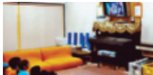
マリンとヤマト不思議な日曜日を！