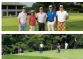
9月19日 (於：高坂カントリークラブ)