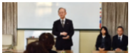
3月5日 源泉研究部会役員会