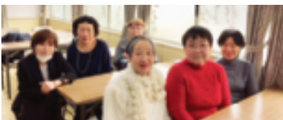
3月4日 女性部会役員会