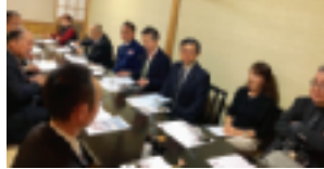
第2支部（滝口支部長）