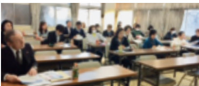
2月6日（女性部会・源泉研究部会）