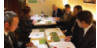
第4支部（鳥居支部長）