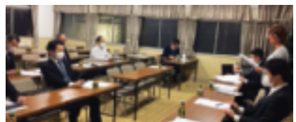
3月6日：青年部会役員会