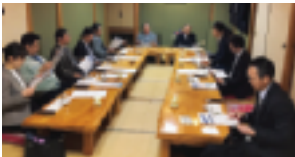
第5支部（谷津支部長）