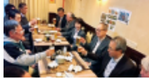
第3支部（飛田支部長）