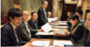
第1支部（久保支部長）

各支部共、令和元年度の事業・収支報告と令和2年度の事業などについて活発に話し合われました。4月開催予定の『春の定時総会&税務研修会』についても意見交換を行いました。