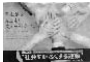
メディックバンを配付

7月2日(月) 8:00～ 西武新宿線・沼袋駅 7月3日(火) 17:00～ 西武新宿線・鷲ノ宮駅 7月10日(火) 15:00～ 東京メトロ丸の内線・中野坂上駅