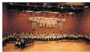
大妻中・高コーラス部