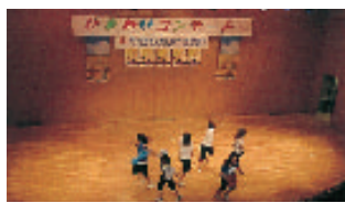
東亜学園創作ダンス部