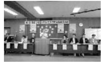
第62回社明推進委員会(勤福会館)