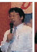
東亜学園校長先生