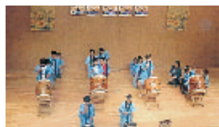
とんとこ会&白桜小の和太鼓