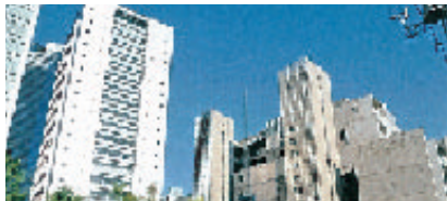
会場の中野の森広場

平成24年7月10日(火)午後4時より 中野の森 (中野坂上、サンブライトビル広場)