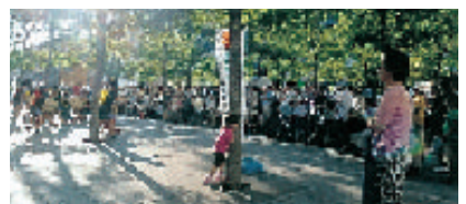
会場には多くの皆様が…