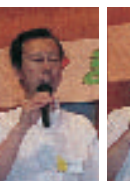
区立第五中学校先生