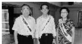
(東部)法人会の名入り襷を掛けて...