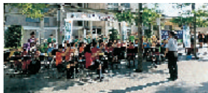
実践学園中・高吹奏部