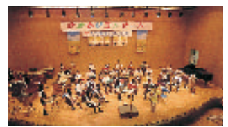
東亜学園 brassバンド部