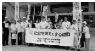
鍋横・桃園地区の皆様