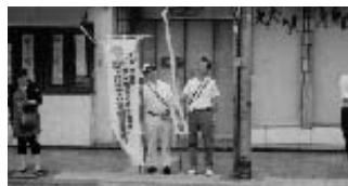
さあ!がんばるぞー!!