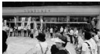
多くの皆様に応援を頂いて...