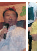
白桜小の校長先生