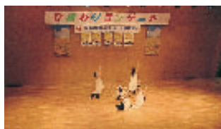
大妻中・高ダンス部