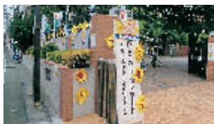
会場の東亜学園高等学校