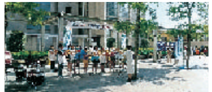
区立塔山小学校・金管バンド