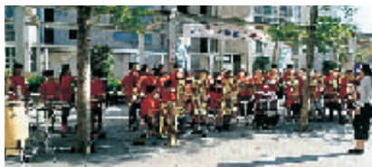
区立桃園小学校・ brassバンド部