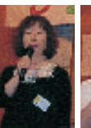
大妻中・高の校長先生