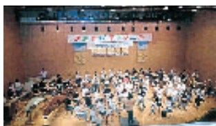
五中吹奏部&アーサー…の皆様