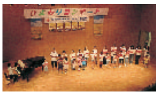
白桜小PTAコーラス部