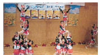
大妻中・高チアリーディング