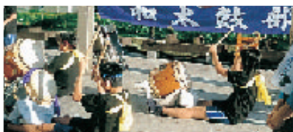
今年から横断幕が…