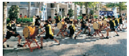
区立第十中学校・和太鼓部