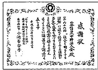
昨年、東京都知事より感謝状が…!