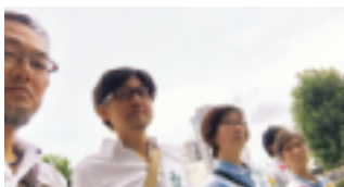
“暑い中ご苦労様でした！”