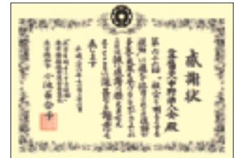
昨年、東京都知事より感謝状が…!