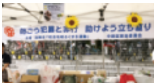
“犯罪や非行を防止しましょう！”