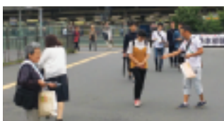
“明るい社会を作りましょう！”