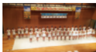
東亜学園(ダンスチアリーダー部)