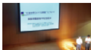
“社会を明るくする運動について”