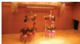
大妻中・高(チアリーディング部)