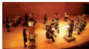
東亜学園(ブラスバンド部)