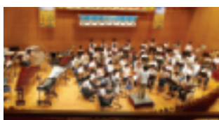
五中吹奏部&アアサー