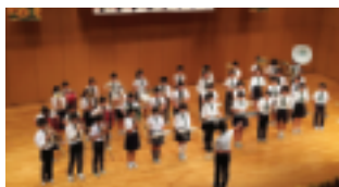
白桜小(白桜アンサンブル)