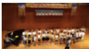
白桜小ホワイトチェリーズ