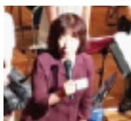
大妻中学高等学校校長