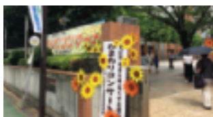
会場の東亜学園高等学校