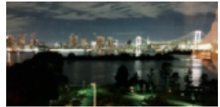
雨上がりのレインボーブリッジは美しい！