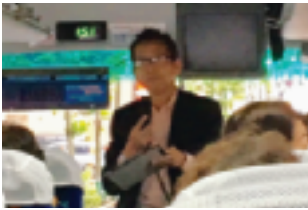
挨拶：宮治実行委員長