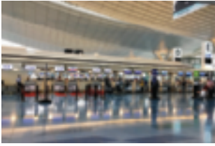
羽田国際ターミナル（買物）