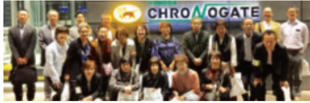
～～～～～ 参加された皆様 ～～～～