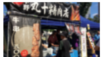
～ 模擬店がズラ～リ… ～