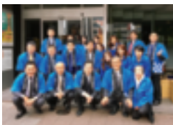
～～～ 応援頂いた皆様 ～～～