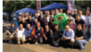
～～ 応援頂いた税務団体幹部の皆様とイータ君 ～～