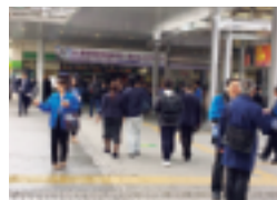
～～ “e-Taxを利用しましょう！” ～～