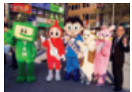
11/5 三税キャンペーン