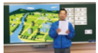
～ 最後の挨拶：宮治様 ～