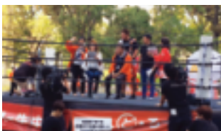
～～ ステージでは…（中野区観光大使の皆様）～～