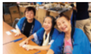
～ 女性部会の皆様 ～