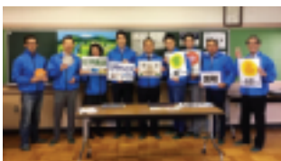
応援して頂いた皆様