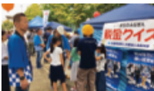
～～～ 皆さん良く考えて答えて下さい ～～～