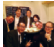
11/21・22 ～～まちなかのバル in 東中野～～