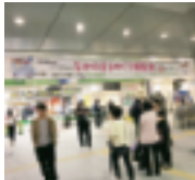
10/20～11/25 なかのまちめぐり博覧会