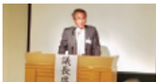
前段で理事会を開催