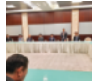
11/1 東法連第4ブロック合同会議 (於:日本閣)