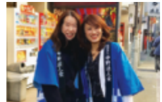
大同生命のお二人