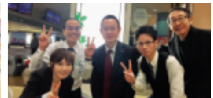
さあ、優勝目指して…!