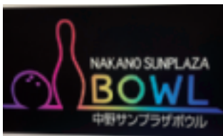
~~~~ 会場のサンプラザホール ~~~~