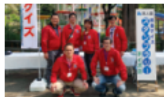
中野の応援頂いた皆様