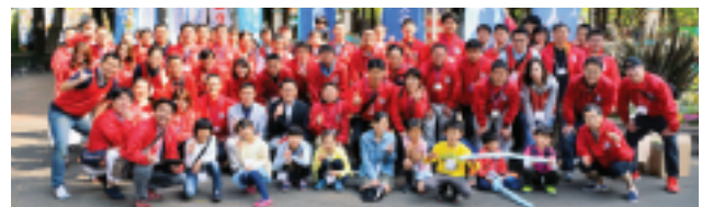
応援頂いた皆様（圧巻です）