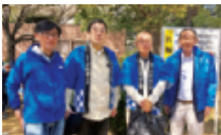
署の幹部の皆様と