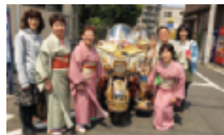
華の会の皆さんとハーレー