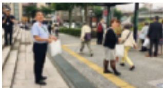
“立ち直りを支えていきましょう！”