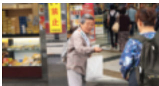
“明るい社会を作りましょう！”