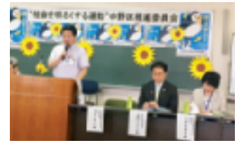
6月20日 中野区推進委員会