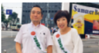
“暑い中ご苦労様でした！”