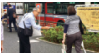
“犯罪や非行を防止しましょう！”