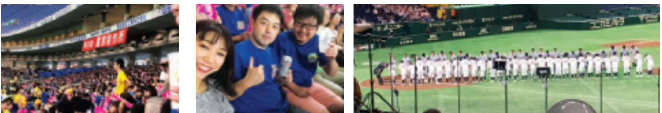
～～～～～ 応援頂いた皆様、本当にありがとうございました。来年乞うご期待!! ～～～～～