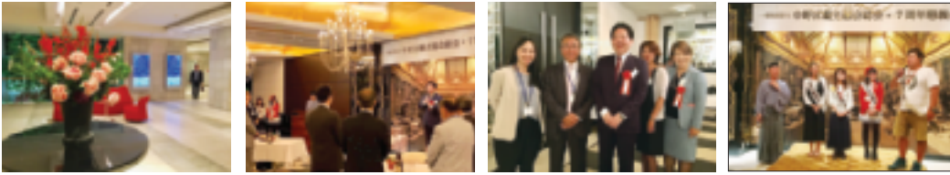
5月27日 (第7回総会) (於: ウェストフィフティーサード・日本閣)