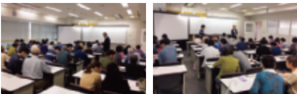
参加された皆様 (於: 専門学校東京テクニカルカレッジ)