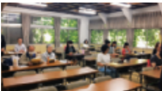
実践に役立つ講義でした!

業務系システム開発に携わった時に経理の文言を耳にした事は何度もあったのですが、それぞれどんな意味や役割なのか説明を受けた事が無かったので、とても勉強になりました。