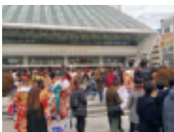
～～～ 会場のサンプラザ前 ～～～