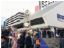
会場のサンプラザ前