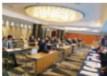
～～～～～ 参加された皆様 ～～～～～