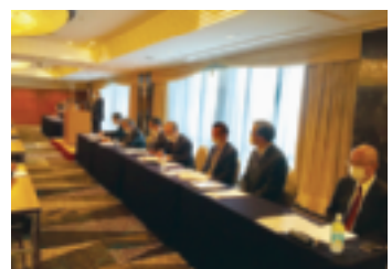
～～ 役員の皆様 ～～