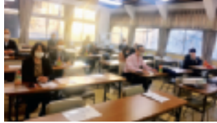
大変内容の濃いセミナーでした