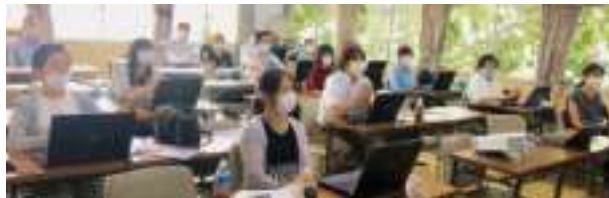
～～～～～ 参加された皆様 ～～～～～