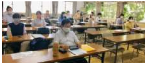
Bコース (経営の改善策・経営に活かす経理＝応用編)