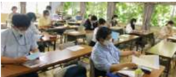
Aコース (初歩の簿記＝基礎・実践編)

このようなセミナーを開催していただいた法人会に感謝いたします。ありがとうございました。