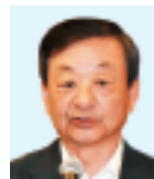
大月税制税務委員長