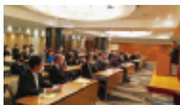
～～ 多くの皆様に参加して頂きました ～～