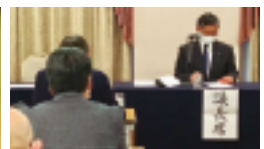
前段で理事会を開催