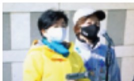
～ 3/6 東京マラソン2021 (吉田先生も参加されました) ～