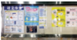
2/16～3/15 確定申告期間 (中野駅ガード下・夢通り)