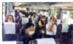
～ 車内の様子 ～