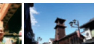
～ “時の鐘” ～