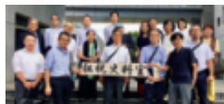
～ 税務大学校を見学 ～