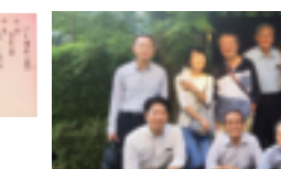
～ ～ ～ ～ ～ 夕食【いも膳】さんで “いも懐石 (さつまいもづくし)” を頂きました ～ ～ ～ ～ ～