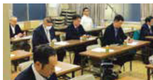
～ 参加された皆様 ～

租税教室に役立つ、大変内容の濃い充実した研修会になりました。ご出席頂いた中野税務署の幹部の皆様に、感謝申し上げます。