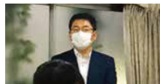
～～ 米持部会長 ～～