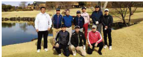
～～～～～ 参加された皆様 ～～～～～