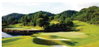
メイプルポイントゴルフクラブ