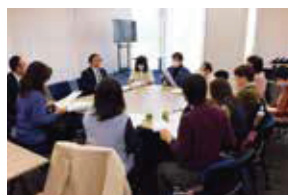
3月14日 女性部会・役員会 (於：中野セントラルパークサウス会議室)

3月14日、女性部会役員会を中野セントラルパークサウス会議室で開催されました。主に、『第43回定時総会』へ向けて役割分担の確認と今度の活動について役員同士で活発な意見交換を行いました。