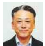
濱税制税務委員長