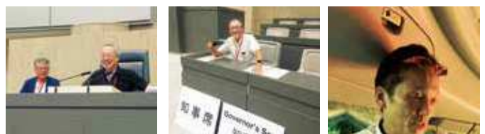
議長席、知事席にて