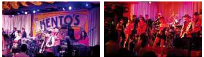
庄巻の生バンド演奏