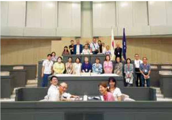
東京都議会議事堂見学