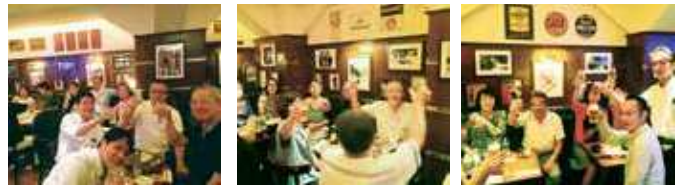
銀座ケントスにて懇親会