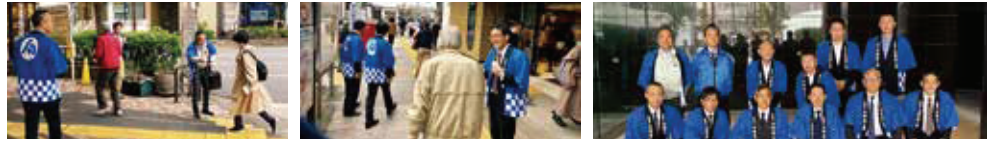
～～～ 中野駅南口周辺にてPR活動 ～～～ ～～ 参加された皆様 ～～