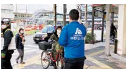
～ e-Tax申告にご協力ください ～