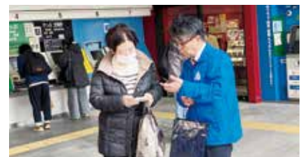
～～～ 中野駅南口周辺で毎年恒例のe-Tax申告の啓蒙、確定申告の開始をティッシュ配りでお知らせしました ～～～