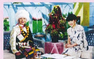
(徹子の部屋にご出演)

時下、ますますご健勝のこととお慶び申し上げます。 平素は、事業運営にご協力を賜りまして誠に有難うございます。 さて、“税を考える週間・特別企画”と致しまして、下記の通り「秋の特別講演会」を開催致します。皆様奮ってご参加頂けますよう宜しくお願い致します。