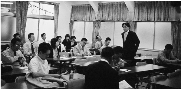
ビデオ研修でしっかり知的武装して…