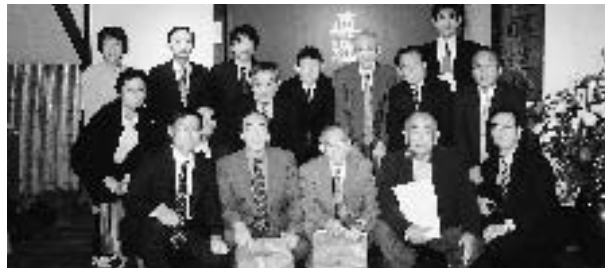
試飲させて頂いた真澄はサイコーでした。

翌朝、湖面にかかる靄を右手にバスは一路安曇野に向いました。安曇野では大王わさび農園へ。皆さん挙って「わさびソフト」を舐めながら、童心に帰って楽しそうでした。