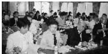
今年の年調は配特がなしか…

宿に着くなりお風呂(本物の温泉)に直行。リフレッシュされた身と心は懇親の席で料理に舌鼓。今や恒例(?)の大ビンゴ大会も成功裡に終わり一日を終えました。