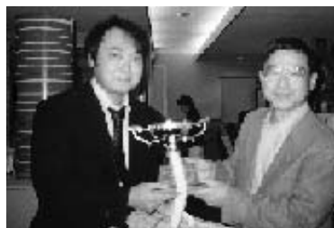
優勝カップはやたら重いよー

普段あまりボウリングをやっていない為、1G目で体力を使いすぎて、2G目の方が点数がおちるんだのですが…。若さのせいでしょう