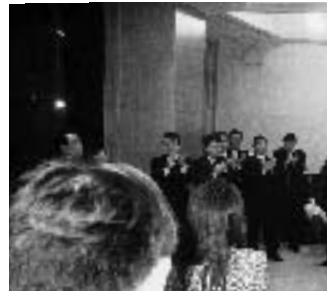
松原初代部会長が高らかに…