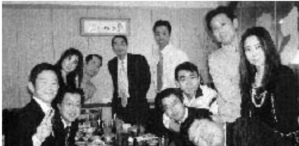
アットホームな中で…

12月21日、中野の「はいから亭」において、忘年会が行われました。急な連絡のため、参加者は10名でしたが、終始アットホームな雰囲気の中、外の寒さも忘れる位のひとときを過ごしました。