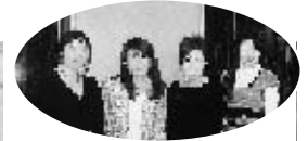
いよー！青年部会の華！