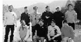
部会長他10名が参加

ゴルフが終わり、毎年お世話になっている宿泊先の南風荘に到着し、のんびり温泉に入った後は待ちに待った懇親会が始まりました。酔いがまわる前にコンペの表彰式を行い、その後は二次会・三次会...大変盛り上がった大宴会となりました。私自身、箱根の管外研修に参加して以来、皆さんと馴染む事が出来て青年部の活動にも積極的に多く出る様になりましたので、なかなか時間が取れないかと思いますが、もっとたくさんの部会員の方々に参加して頂けたらと思います。