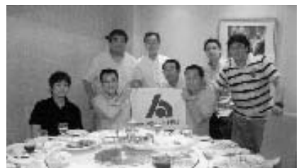
上海最大の生簀料理店“寧波海鮮料理店”にて夕食