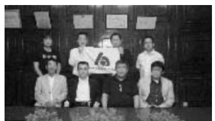
“上海貿基食品有限公司”工場を視察