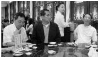
世界一の小籠包“南翔饅頭店”で朝食