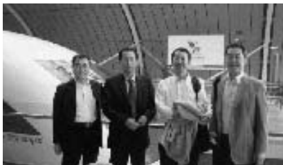
リニアモーターカーの前で

上海は、30年前の街と現代のお洒落な街と浦東の様な未来都市とが、道を隔てて隣合っております。今後どの様に変化をしていくのか、大変に興味深いものです。