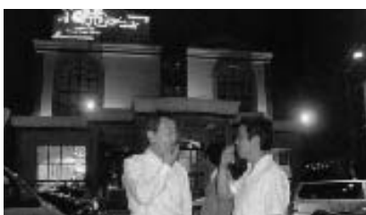
“小南国”食後のひととき