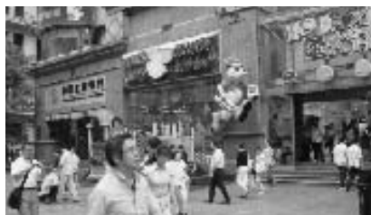
上海の商店街 南京東路視察