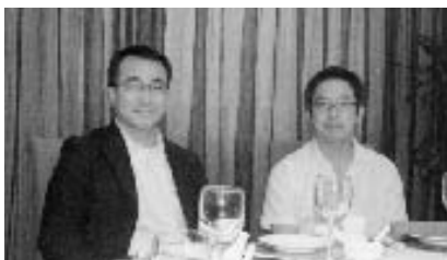
レストラン“小南国”