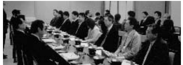
まるでOB会のような盛況でした