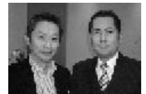
イヨ〜! イケメン二人