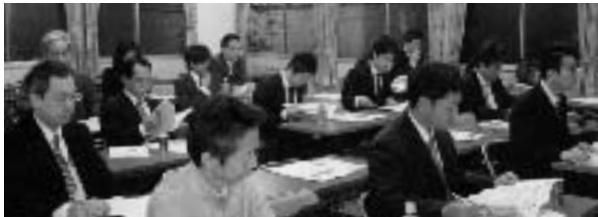
新たな税制改正に皆さん真剣です

さて、研修ですが、特に、◎減価償却について◎損金不算入制度の整備◎留保金制度の整備等について話されました。こうした税制改正は毎年行われますが、私達経営者にとって、本当に良く考