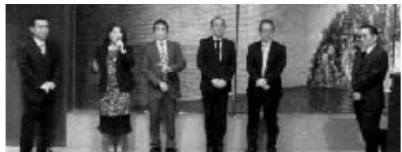
青年部会・役員の皆様