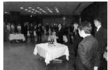
多くの皆様に参加して頂きました

又、新入会員の方や初めて参加された方も、爽やかな自己紹介と法人会青年部会に対する思いを話され、先輩の部会員も大変ほのぼのとして熱気に包まれ大盛会裏に終了しました。