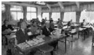
2月2日「源泉研究部会」