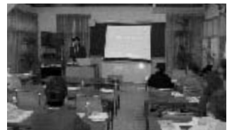
「制度をうまく利用して下さい」