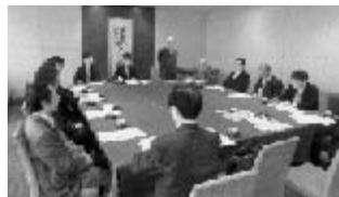
3月22日「源泉研究部会」