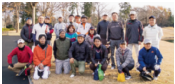
精鋭20名が熱い戦いを…!