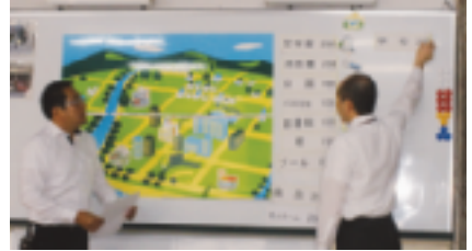
(12月12日 事前デモ 於：法人会館)