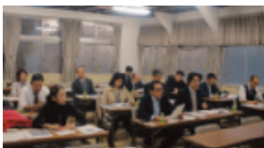
あくまでも基本が大事です

中野法人会は毎年「講師養成研修」を行っている事もあり、講師の候補者は、大勢いますが、それでも改めて