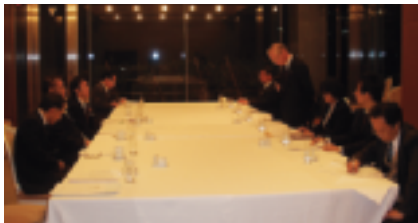
12月2日：役員会を開催（於：日本閣）