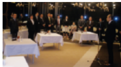
～ 和やかな雰囲気です…! ～