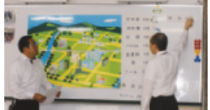
(12月12日 事前デモ 於：法人会館)