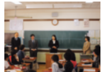
“職業紹介コーナー”