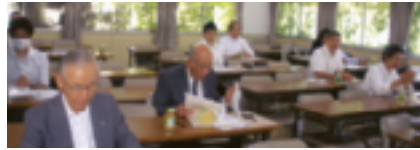
6月4日 (源泉研究部会)