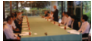
7月16日 役員会 (於：ウェストフイフイサード)