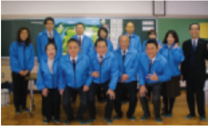
～～～ 応援して頂いた皆様 ～～～