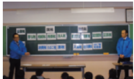
約50種類の税金があります!