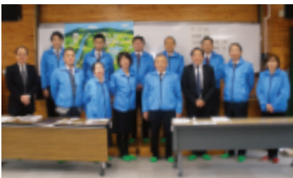
～～～ 応援して頂いた皆様 ～～～