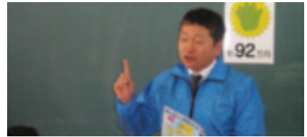
“お願いが…(柴野顧問)”