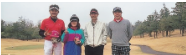
~~~~ さあ! 優勝を目指して…! ~~~~