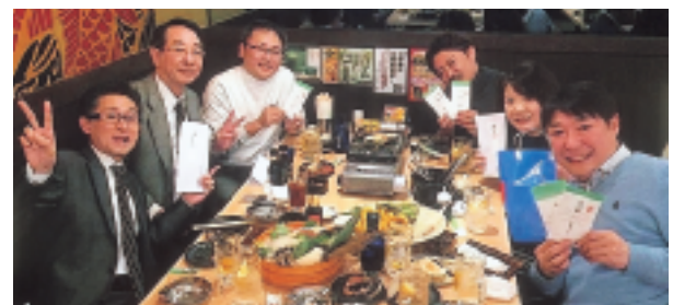
~~~~ 終了後の表彰式・懇親会 ~~~~