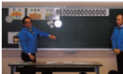
平成26年度の消費税は?