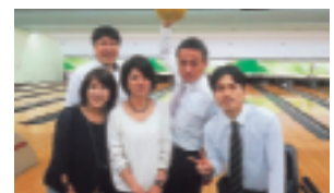
来年こそ優勝するゾ～!