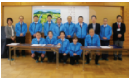
～～～ 応援して頂いた皆様 ～～～