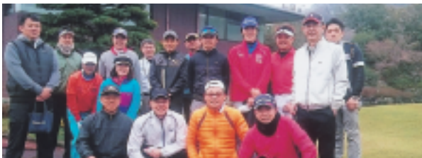
~~~~ 参加された皆様 ~~~~