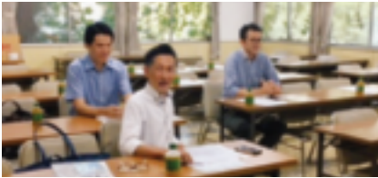
署の幹部の皆様と親しく意見交換会