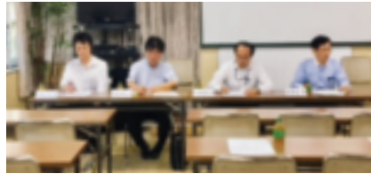
～ 署の幹部の皆様 ～