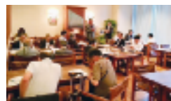
6月13日(木) 合同役員会