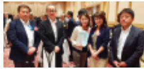
～ 参加された皆様 ～