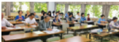
6月6日 参加された皆様