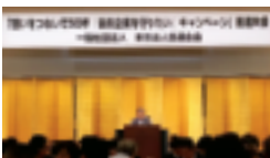
7月25日 推進大会 (於：京王プラザホテル)