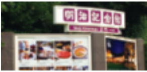
会場の明治記念館