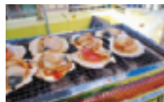
～～～ 晴天に恵まれ大盛況のBBQ大会でした ～～～