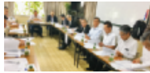
～ 熱心な審議が… ～