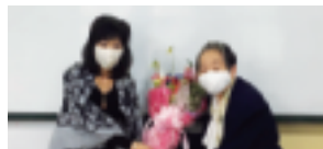
前・高野部会長に花束贈呈