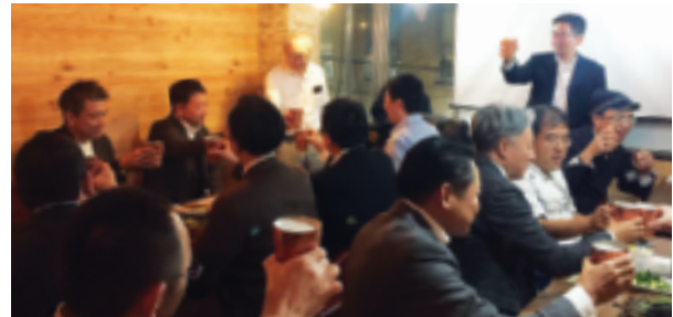
～ 2023年、青年部会員の皆様、お疲れ様でございました!! ～