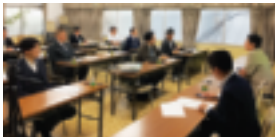
～ 参加された皆様 ～