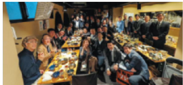
～ 盛会のうちに終了。皆さまお疲れ様でした! ～